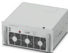
CHARX power, Модуль быстрой зарядки для зарядных станций постоянного тока, вход: 3-фазный, выход: 200 В DC...920 В DC / 125 А

Обратите внимание на то, что приведенные здесь данные взяты из online-каталога. Полная информация и данные содержатся в документации пользователя. Действуют Общие условия использования для информации, загруженной из интернета. ( http://phoenixcontact.ru/download )